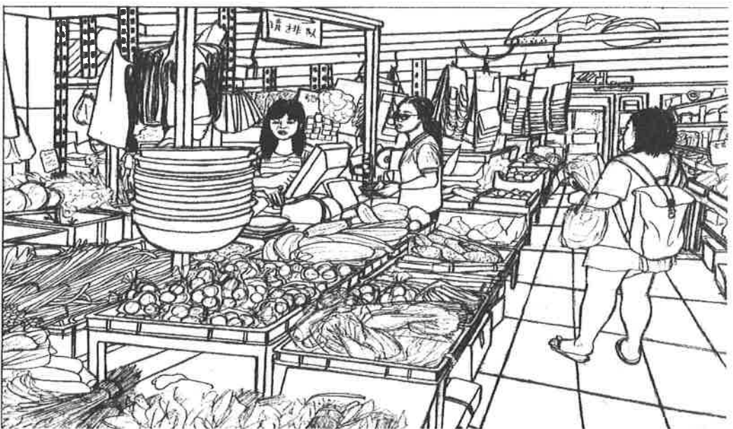
(අනෙක් පිටුව බලන්න)